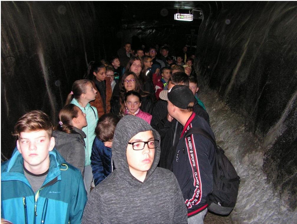
Torda - sóbányában