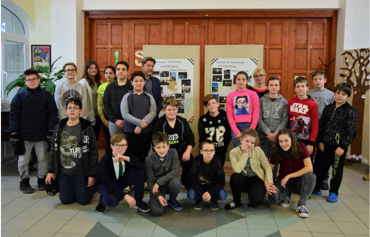
Csoportkép a találkozó végén