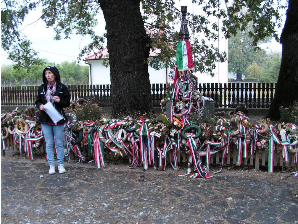
Tamási Áron nyughelye