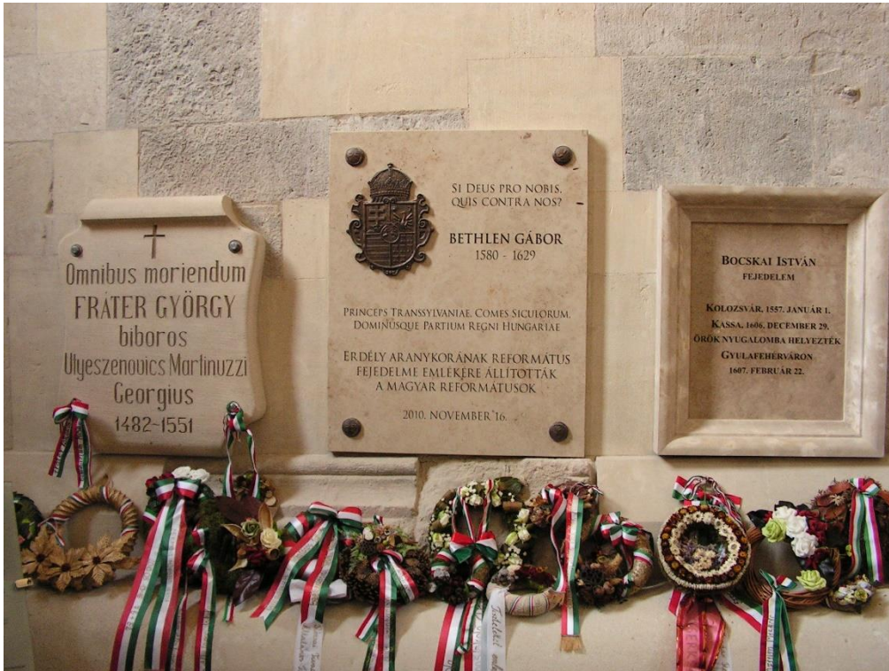
Székesegyház – Gyulafehérvár