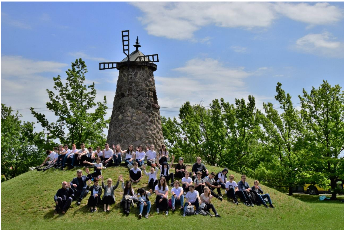
Szarvas – Trianon