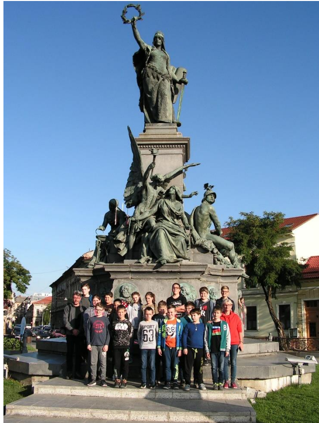
Szabadság- emlékmű – Arad