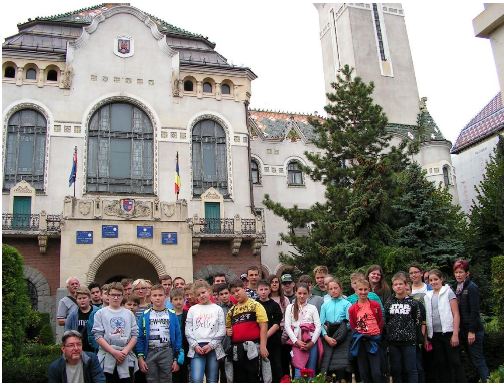
Marosvásárhely – Városháza