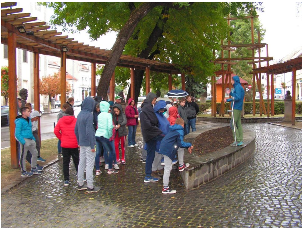
Székelyudvarhely – Szoborpark