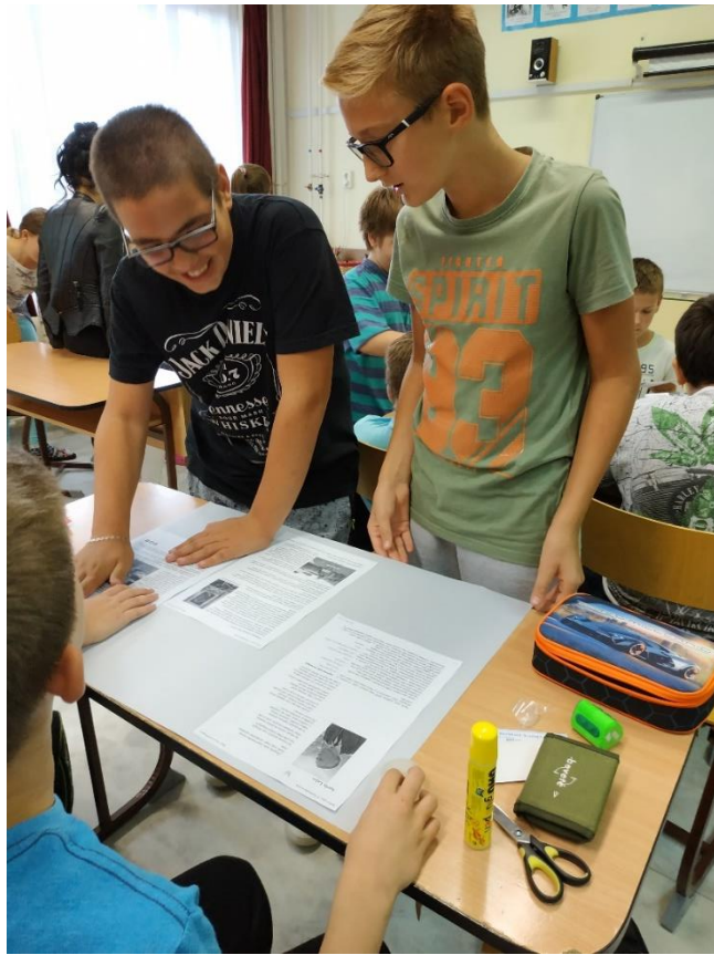
Előkészítő óra 3.