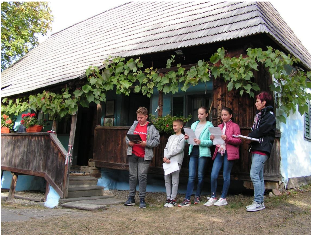
Tamási Áron szülőháza – műsor