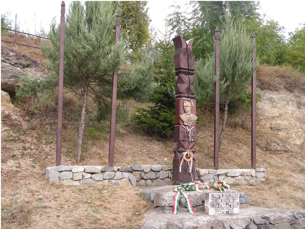
Vasvári Pál emlékműve – Körösfő