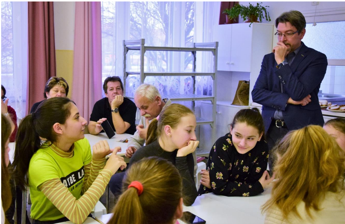
Interaktív játékos feladatok