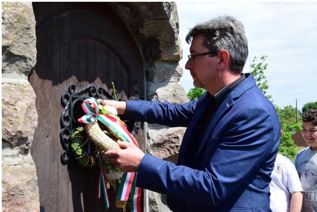
Szarvas – Trianon