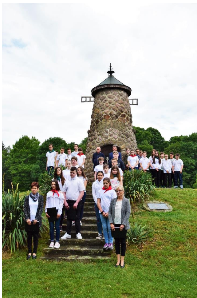
Szarvas - Trianon