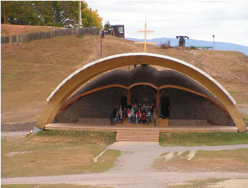
Búcsújáróhely - Csíksomlyó