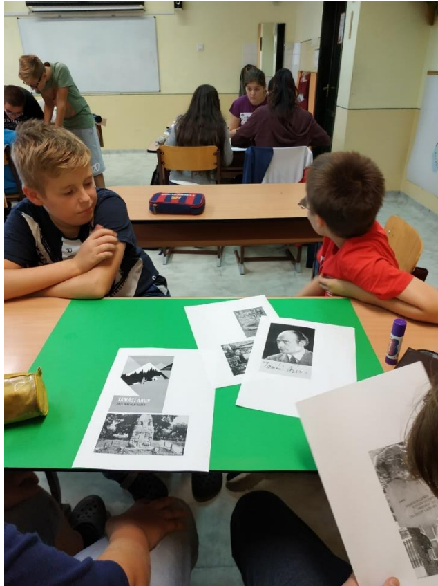
Előkészítő óra 4.