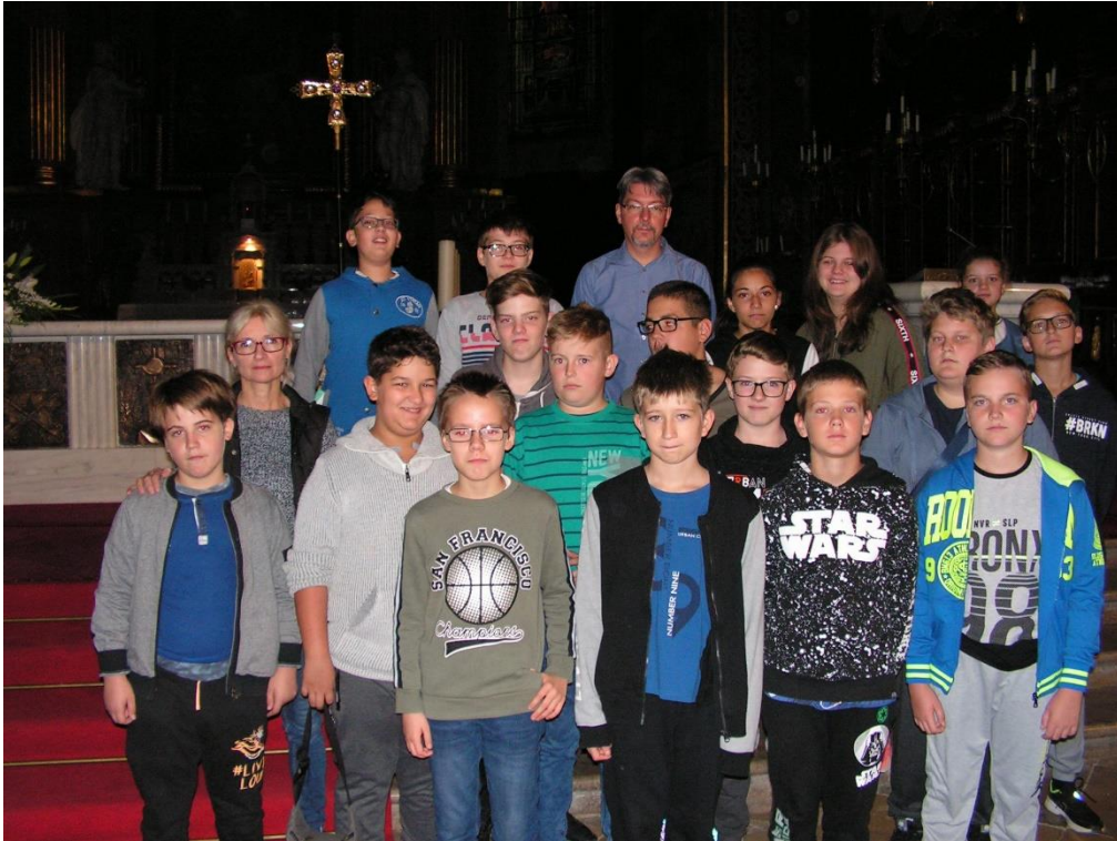
Székesegyház – Nagyvárád