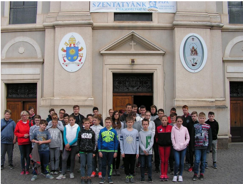
Kegytemplom – Csíkszereda