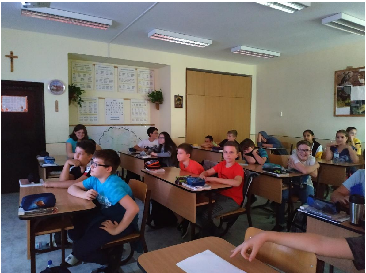
Előkészítő óra 2.