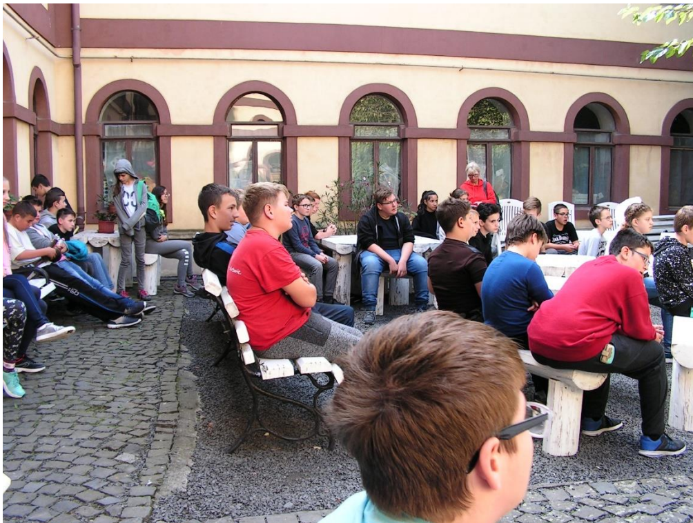
Déva – Gyermekekotthon