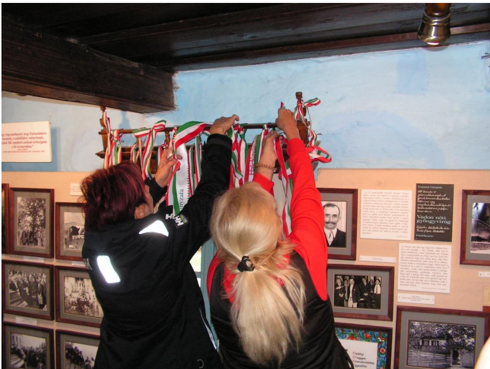
Tamási Áron szülőháza