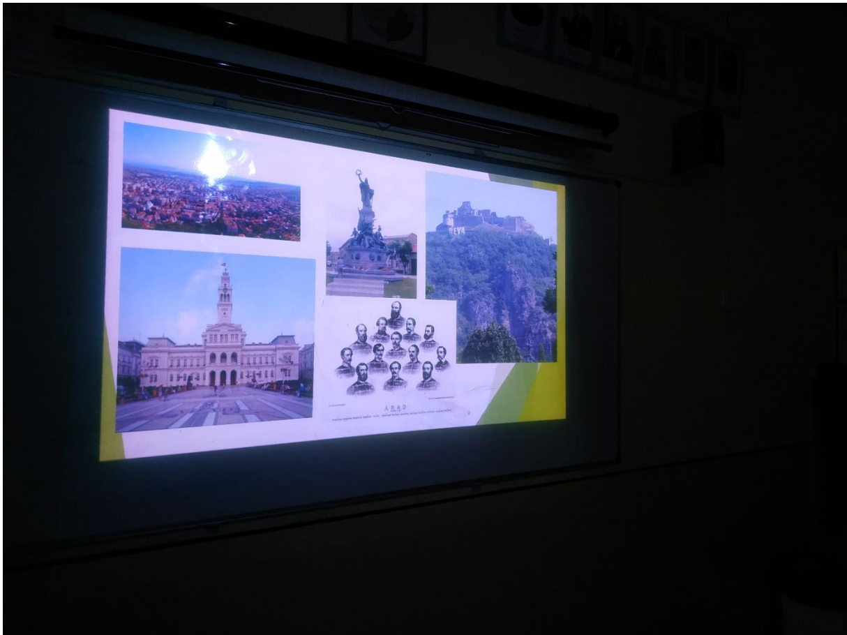
Előkészítő óra 1.