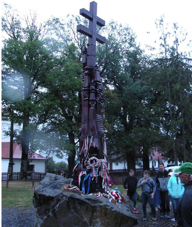
Trianon-emlékmű – Farkaslaka