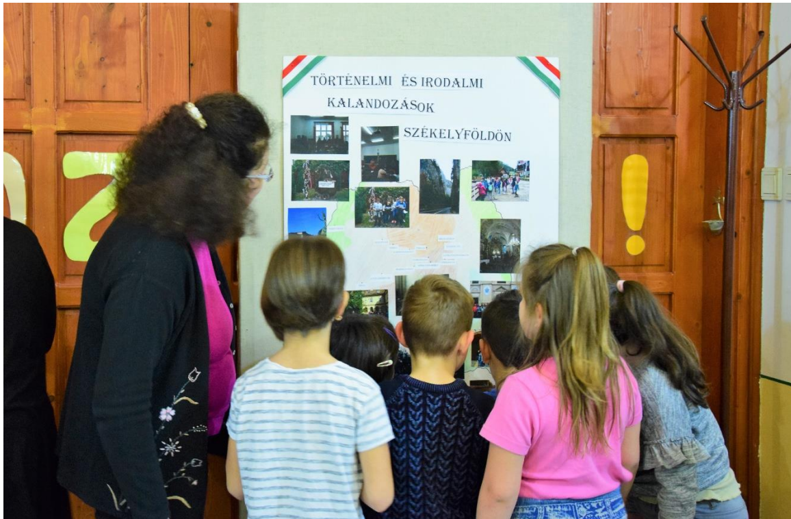
Kisdiákok a tabló előtt